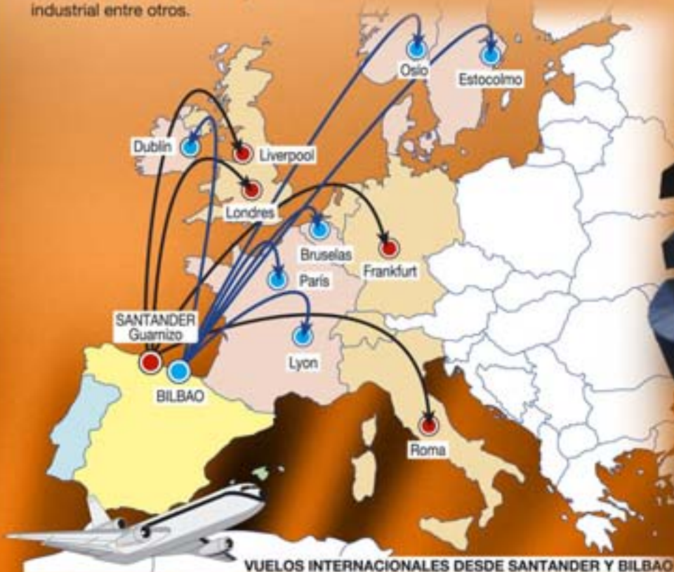
VUELOS INTERNACIONALES DESDE SANTANDER Y BILBAO

Montajes Gomur es una empresa con más de treinta años de experiencia en las actividades del Montaje, Mantenimiento y Construcción de Maquinaria Industrial . Ofrece servicios integrales de mecanizados, calderería, construcción de maquinaria llave en mano y mantenimiento industrial entre otros.