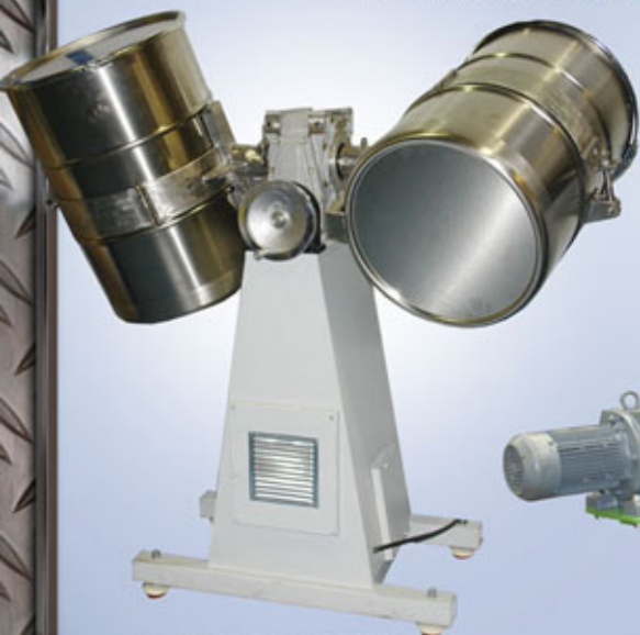
MEZCLADORA DE PRODUCTOS PRODUCTS MIXER MÉLANGEUSE DE PRODUITS