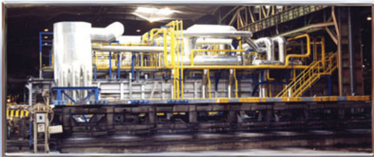
HORNO TREN DE LAMINACIÓN MILL TRAIN FURNACE FOUR DE CHAUFFAGE. TRAIN DE LAMINAGE