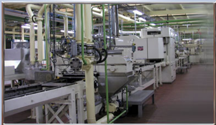
LÍNEA PRODUCCIÓN DE CHOCOLATE CV 600 CV=600 CHOCOLATE PRODUCTION LINE LIGNE DE PRODUCTION DE MOULAGE CV 600