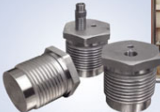
TRABAJOS DE MECANIZADO MACHINING WORKS TRAVAUX D'USINAGE