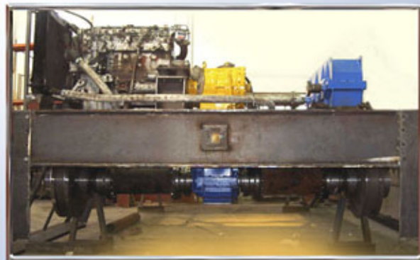
CONSTRUCCIÓN, MONTAJE Y ALINEACIÓN DE UN CARRO DE CESTAS DE 800 TN CONSTRUCTION, ASSEMBLY AND ALIGNMENT OF 800 MT CRATE TROLLEY CONSTRUCTION, MONTAGE ET ALIGNEMENT D'UN CHARIOT DE POCHES DE COULÉE DE 800 TONNES

SERVICIOS ESTRUCTURADOS DE MENOR A MAYOR IMPLICACIÓN EN LA EMPRESA CLIENTE