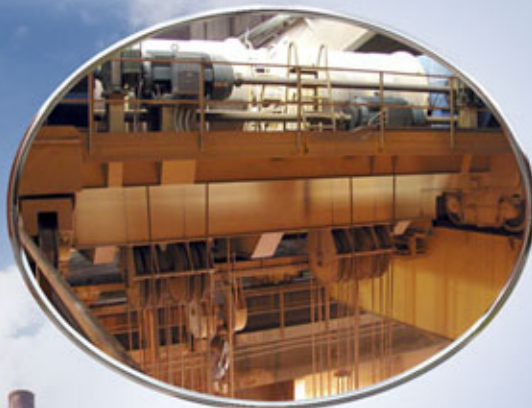
PUENTE GRÚA 250 TN 250 MT CAPACITY GANTRY CRANE CHARIOT D'ÉLEVATION DE PONT ROULANT DE 250 TONNES