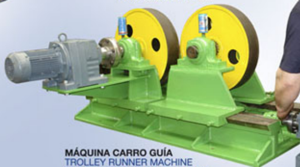
MÁQUINA CARRO GUÍA TROLLEY RUNNER MACHINE MACHINE CHARIOT DE GUIDAGE