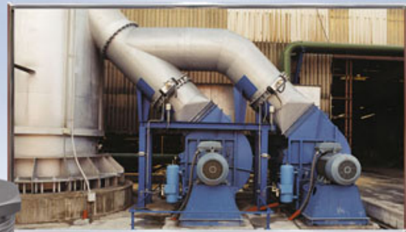
VENTILADOR DE ASPIRACIÓN SUCTION VENTILATOR VENTILATEUR D'ASPIRATION